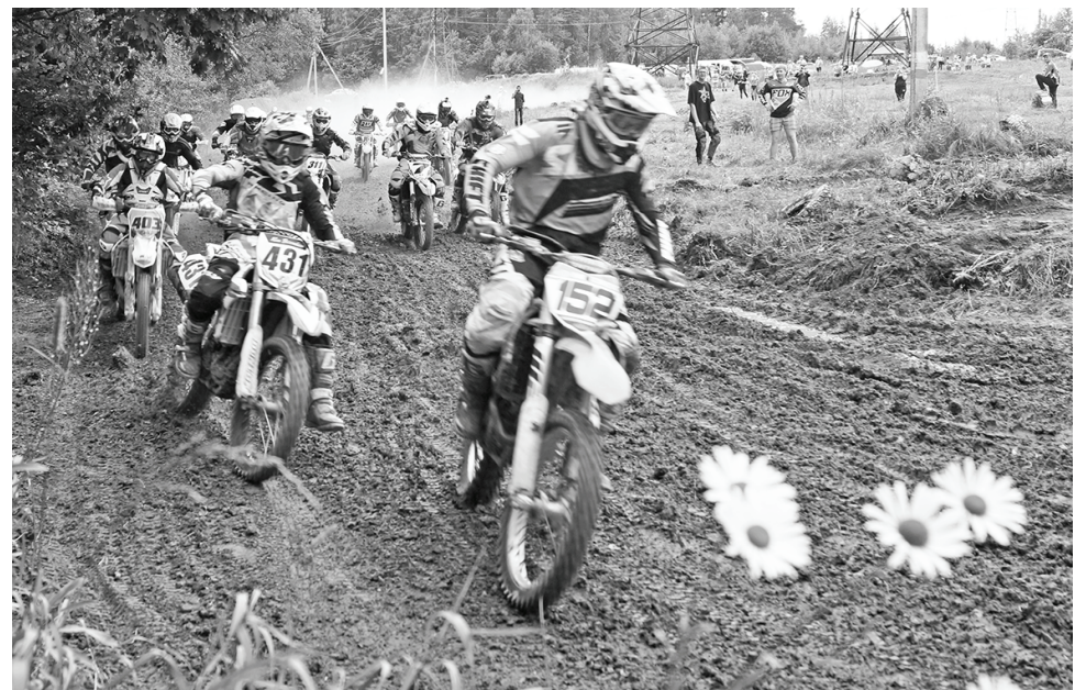
Заезд в классе Open-1.